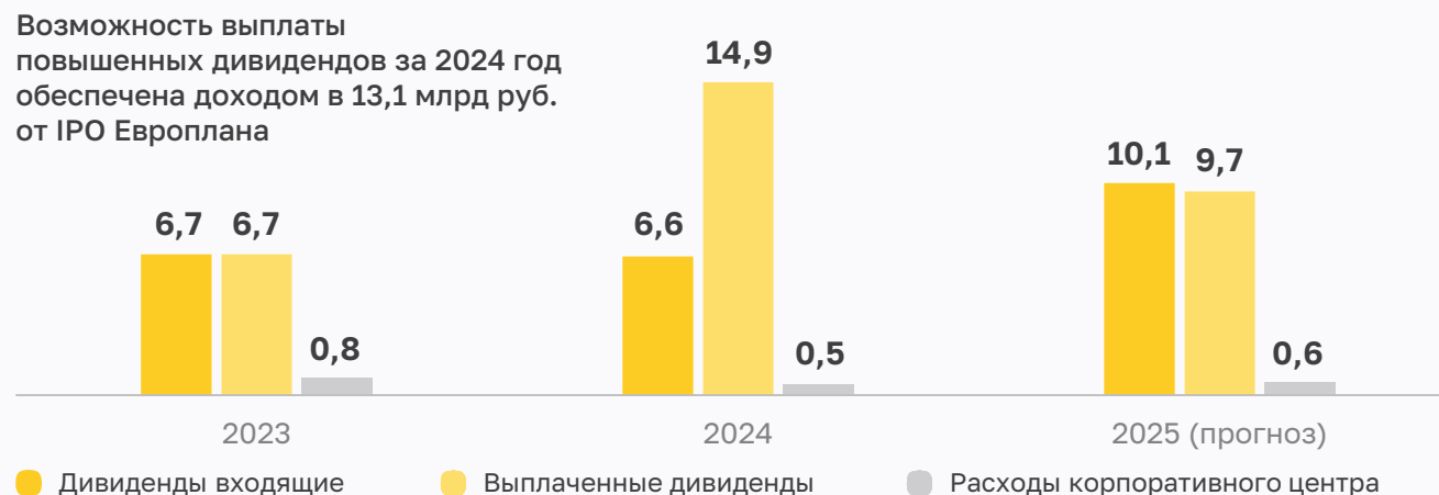
Соотношение полученных и выплаченных дивидендов, млрд руб.

2 За счет максимизации дивидендов от дочерних компаний, эффективного управления активами (в т.ч. ликвидностью), нулевого долга и сокращения расходов корпоративного центра SFI обеспечивает стабильные финансовые результаты и возможность выплаты дивидендов в пользу собственных акционеров.